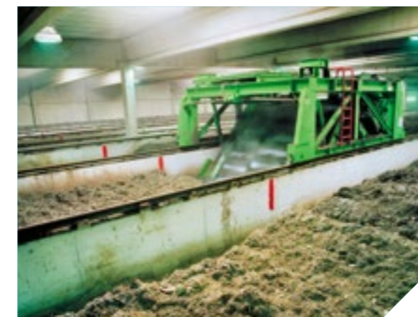
BioFIX - Zeilenkompostierung