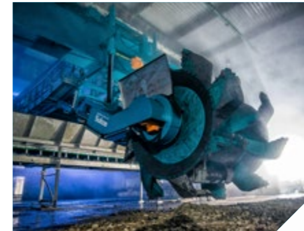
Wendelin - Tafelmietenkompostierung