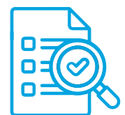
ÜBERGABE & SCHULUNG