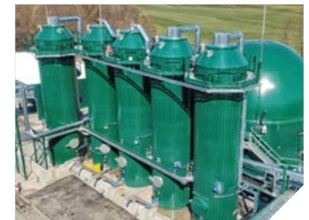
BioPV - Bioabfall-Presswasservergärung