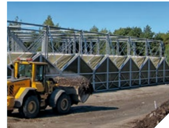
BIODEGMA® - Membrantechnologie